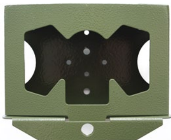
Metallcase für erweiterten Schutz