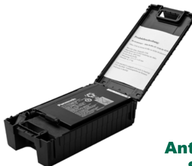
Antenne zur Signal- verstärkung