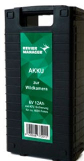
Akku-Koffer für längere Betriebs- dauer der Kamera